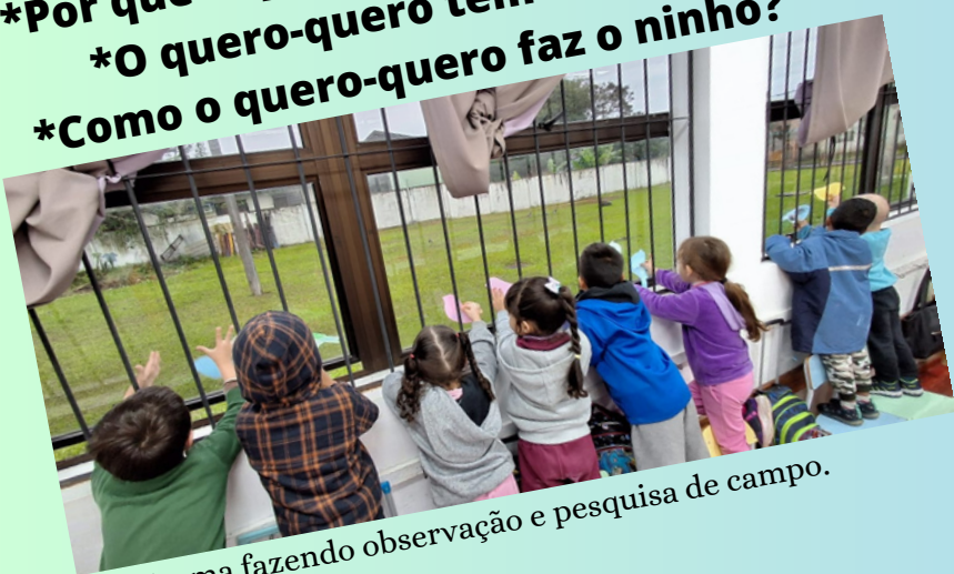
Turma fazendo observação e pesquisa de campo.

Descobrir por que há tantos quero-queros vivendo em nossa escola. Como o quero-quero se alimenta, se desenvolve e se reproduz; Descobrir por que seu grito é tão alto; Entender o mecanismo de defesa que mantém seus predadores afastados.