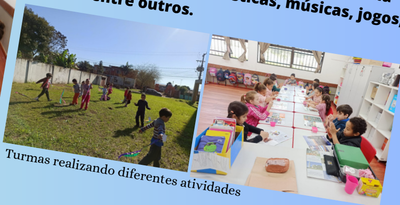
Turmas realizando diferentes atividades