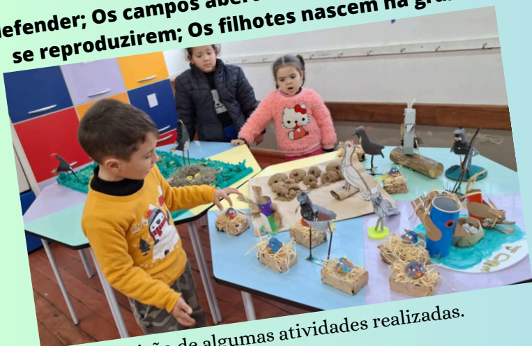
Exposição de algumas atividades realizadas.

“Os quero-queros usam o esporão para se defender; Os campos abertos são seguros para eles se reproduzirem; Os filhotes nascem na grama”